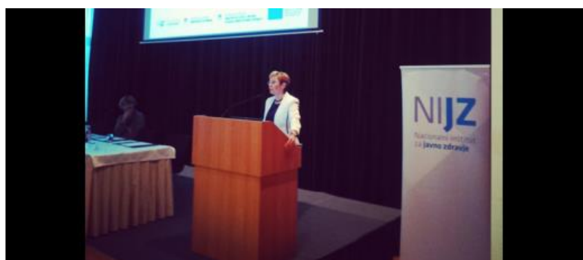
Slika 7: Primer objave na Twitterju

Na spletnem družbenem omrežju Twitter Nacionalnega inštituta za javno zdravje (NIJZ) smo poleg ostalih tem večkrat izpostavili tudi temo staranja v Sloveniji in projekt AHA.SI ter s tem seznanjali javnost o aktivnostih na tem področju. Na Twitterju nam med drugimi sledijo deležniki, ki imajo svoje profile, to pa nam omogoča, da jih »poslušamo« in zbiramo povratne informacije v realnem času. Spremljanje in komunikacija z deležniki na tem omrežju nam tako zagotavlja vir pridobivanja vpogleda v njihovo percepcijo, odnos in znanje v odnosu do določenih tem. Z orodjem TweetDeck jih spremljamo glede na izbrano vsebino (staranje, pokojninska reforma, upokojevanje, dolgotrajna oskrba ...), ki jo delijo in tako prestrežemo sporočila, ki jih ustvarijo in delijo. Ne samo, da se medsebojno spremljamo, omogoča nam predvsem, da se vsebinsko povezujemo in širimo skupna sporočila. Poleg tega je tudi pomembno orodje za komuniciranje z mediji, saj so novinarji med najbolj aktivnimi tviteraši. Priloga 17 – Twitter objave.