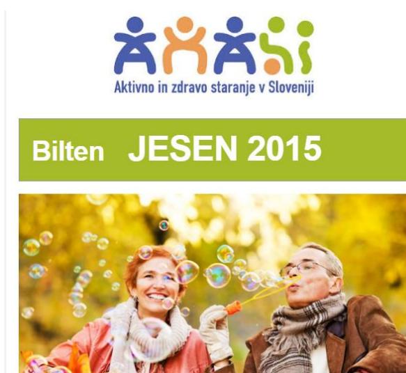
Slika 6: Bilten projekta AHA.SI

V projektu AHA.SI smo na vsake tri mesece izdajali projektni bilten in ga posredovali deležnikom projekta na podlagi oblikovane liste deležnikov. Vse biltene smo objavili tudi na spletni strani projekta in socialnem družbenem omrežju Twitter. Vsebovali so ključna sporočila posameznih vsebinskih sklopov, zadnje novice in pomembne aktivnosti projekta AHA.SI ter napovednik dogodkov. Zadnji tri številke so bile oblikovane v spletnem orodju MailChimp, ki poleg široke grafične in tehnične uporabnosti omogoča spremljanje spletne statistike vedenja uporabnikov. Podporna statistika zadnjih številok biltena nam omogoča spremljanje spletne aktivnosti deležnikov v odnosu do tega ali berejo bilten, katere tematske sklope spremljajo v največji meri in kolikokrat so se na bilten vrnili (gre za enkratno ali večkratno odpiranje posameznega sporočila). Spletno mreženje v obliki elektronskega biltena poleg vsebinskega vidika krepi povezovanje in skupna prizadevanja vseh deležnikov, ki sodelujejo pri projektu. Priloge 13-16).